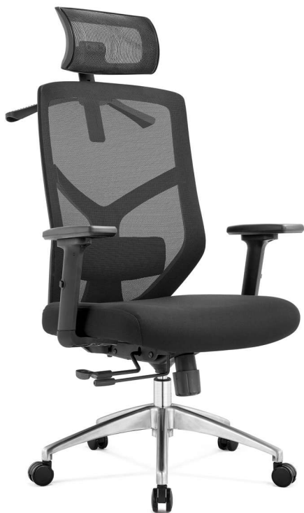
Fotel ergonomiczny rOsa

Fotel biurowy Rosa został zaprojektowany tak aby spełniać najnowsze normy BHP Siedzisko jest przesuwne do przodu i do tyłu o 4,5 cm wyposażony jest w wieszak na ubrania Zagłówek 2D można regulować w pozycji góra-dół oraz pod kątem 50° Nowoczesne podłokietniki 3D Wielofunkcyjny mechanizm MULTIBLOCK Oparcie z wspornikiem lędźwiowym 2D