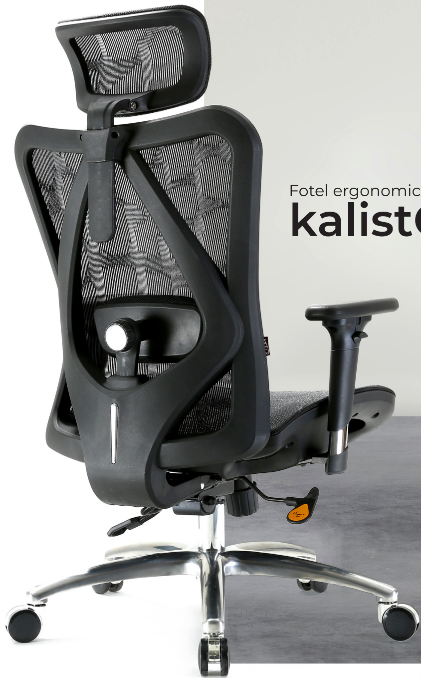
Fotel ergonomiczny kalisto